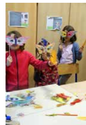
Ateliers artistiques VS Art Jeunes

La rentrée des ateliers s'est faite dans 9 écoles des 13ème, 14ème, 18ème et 19ème arrondissements. Nous n'avons pu malheureusement assurer, faute de bénévoles, l'ouverture de 2 ateliers dans des écoles des 18ème et 20ème arrondissements qui le souhaitaient.