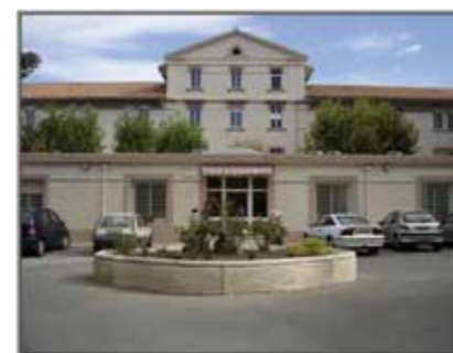
Centre JB. Fouque - Marseille