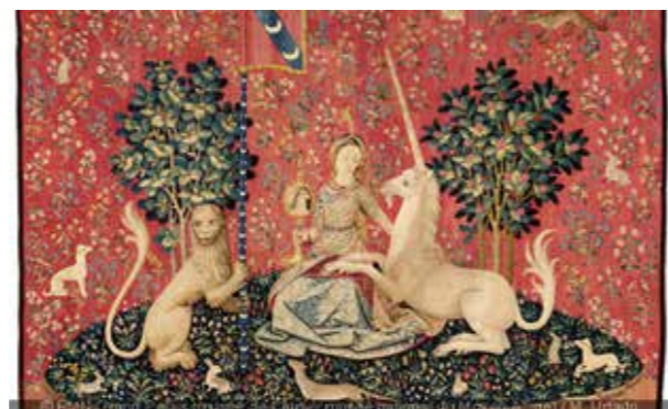
Magiques Licornes, l'exposition au musée de Cluny

Mais c'est également l'occasion de découvrir, au Musée du Louvre notamment, les personnages de la mythologie grecque à travers les magnifiques sculptures de l'Antiquité, à l'Institut du Monde Arabe, les légendes et contes orientaux et, au Musée de Cluny, les licornes mythiques des grandes tapisseries de la Renaissance.