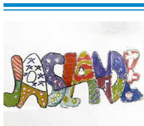
A la manière de Brito

Nos 10 bénévoles font découvrir aux enfants l'univers créatif d'un artiste comme Picasso, Brito, Bonnard... L'intérêt s'éveille, les enfants trouvent l'envie de s'exprimer et de créer leurs propres oeuvres : Papier, carton, peinture, ciseaux, fil de fer, sable, colle, tout est utile pour imaginer et créer. Depuis fin 2018, Récré Art développe une animation musicale, où chaque enfant découvre le son à travers un ensemble d'instruments à cordes et à vent... Un autre univers artistique très bien accueilli par les enfants.