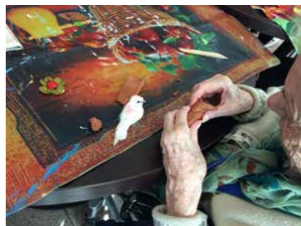
atelier modelage Résidence Marie à Bagnolet

D'autres ateliers sont actuellement en projet, touchant notamment à l'expression écrite et au théâtre.