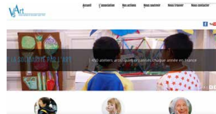
capture d'écran page d'accueil VS Art.org

Toujours dans cet objectif, un travail d'approche a commencé fin 2018 auprès de grandes entreprises afin de les solliciter à inviter VS Art à se présenter lors de réunions d'information organisées pour leurs personnels proches de la retraite.