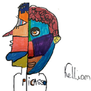
A la manière de Picasso

Une parenthèse, une ouverture sur l'extérieur dans le quotidien des enfants hospitalisés de 6 à 15 ans.