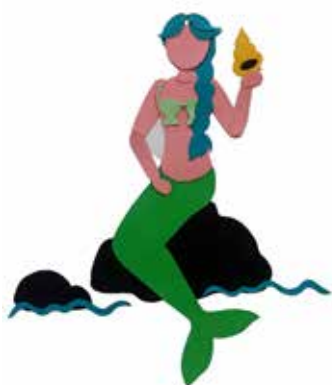
Atelier à la manière de Matisse au CHI de Créteil animé par Céline.

Depuis janvier, Récré-Art a réalisé une vingtaine d'ateliers. Une belle performance pour cette période bien compliquée .