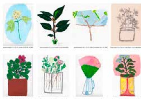
Réalisations atelier animé par Mad à la prison de Fresnes.

Pour finir, à ma remplaçante, j'aimerais dire : Le désir est fragile, surtout dans les circonstances de l'enfermement. Il faut le respecter et surtout laisser à chacun l'initiative de l'exprimer à sa façon.