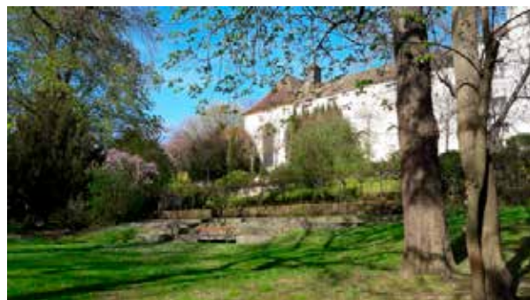
Le musée départemental Maurice Denis - une vue du jardin -.

Cette année, la 20ème sortie des bénévoles nous ouvrira les portes du Hameau de la Reine, totalement rénové, et du petit Trianon. Suivra un déjeuner entre Versailles et Saint Germain en Laye où nous visiterons cet ancien hôpital construit sous Louis XIV et acheté par Maurice Denis en 1914 pour y installer sa famille et son atelier. Une très belle demeure d'artiste, elle aussi entièrement restaurée, aujourd'hui devenue le musée qui porte son nom. Denis, bien sûr, mais aussi Gauguin, Sérusier, Bonnard,... les œuvres présentées, à la charnière des 19ème et 20ème siècles sont incontournables pour qui souhaite comprendre les origines de l'art moderne.