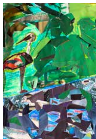
Atelier du centre de loisirs Choisy (75013) animé par Françoise. Réalisation inspirée de la fable de La Fontaine "Le Héron" façon Chagall.

Depuis le début de l'année scolaire (Septembre) et malgré les diverses dispositions sanitaires qui se sont succédées, nous avons pu ré-ouvrir progressivement 7 ateliers (au lieu de 9 l'an dernier) dans des écoles des 13ème, 14ème, 18ème et 19ème arrondissement. 6 nouvelles bénévoles ont rejoint l'un ou l'autre de ces ateliers et les enfants continuent à travailler sur le même thème que l'an dernier : "L'eau dans tous ses états".