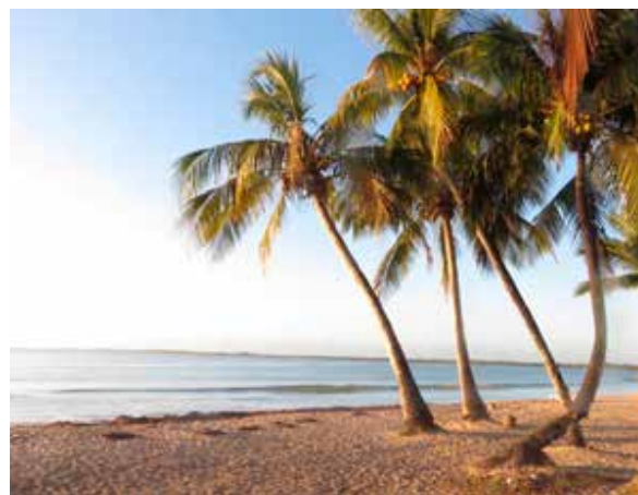
Playa Larga Cuba.

Après la conférence VSart, chacun pourra rêver aux paysages, aux monuments qui auront été montrés. Lors des visites de membres de leur famille ou d'amis, les résidents partageront avec ceux-ci le voyage que VSart leur a offert