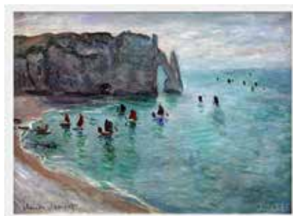
Claude Monet - Bateaux de pêche.

Au seuil de cette nouvelle année scolaire, nous reprenons progressivement les activités dans les différents centres, mais nous manquons cruellement de bénévoles et il n'est pas sûr que nous puissions ré-ouvrir tous les ateliers.... A fortiori, et malgré la demande des écoles, nous ne pouvons pas en ouvrir de nouveaux, notamment dans des quartiers où les enfants ont trop rarement l'occasion de pénétrer dans le monde de l'art et de la culture.