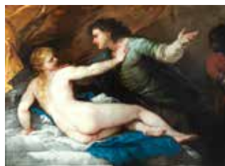
Lucrece et Tarquin

à la Philharmonie de Paris du 11 octobre 2019 au 26 janvier 2020. Cette exposition vous propose de redécouvrir l'œuvre du maître du cinéma muet dans sa dimension musicale et, plus largement, dans son rapport étroit à la danse, au rythme, à l'illusion de la parole et du son, tous rigoureusement « orchestrés » dans chacune de ses œuvres.