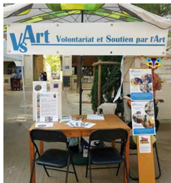
Stand VSArt Montpellier le 15 septembre à l'Antigone des Associations.

En cette rentrée 2019, le sourire est donc là et le moral est au beau fixe ! Nous allons pouvoir poursuivre nos activités sereinement, voire les développer si la majorité des bénévoles rencontrés s'engagent à nos côtés.