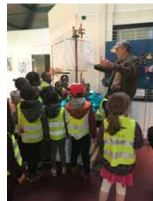
Exposition VSart Jeunes 2019.

Rendez-vous en juin 2020 pour voir comment les enfants se seront emparés de ce thème qui devrait les inspirer.