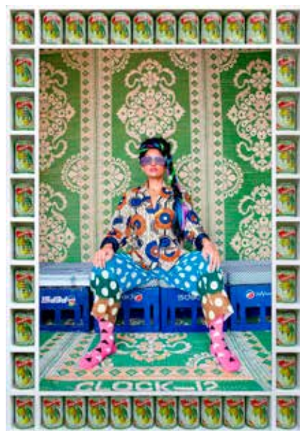
Exposition Hassan Hajjaj à la MEP à partir du 11 septembre.

Agenda et informations complémentaires disponibles sur vsart.org